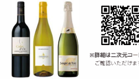
※詳細は二次元コードからご確認いただけます。

サイズ/44×25.5×15cm 素材/アルミニウム合金(内面:フッ素樹脂塗膜加工、外面:焼付塗装、底面:鉄溶射加工)、強化ガラス 仕様/直火・IH対応