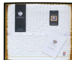
今治 アメリカンシーアイランドコットン バスタオル

サイズ/29.7×21×2.5cm 仕様/最大計量:150kg、最小表示:100g(0~100kg)・200g(100~150kg) 付属品/単4形乾電池×4(お試し用) ※型番:BC-718-WH