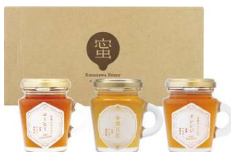
金澤やまぎし養蜂場 日本と世界のはちみつセット