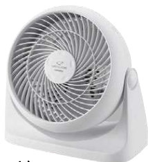
ツインバード サーキュレーター