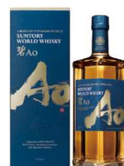
サントリー ワールドウイスキー 碧Ao

サイズ/10.5×10.5×33.5cm 重さ/900g 仕様/消費電力:2.2W、充電式、連続使用時間:10分 付属品/すき間ノズル、ACアダプター ※型番:HC-EB07W