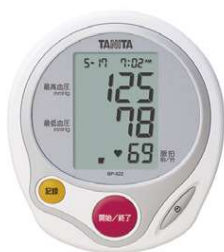
タニタ 上腕式血圧計

セット内容/各750ml×3本 ※ラベル等内容が変更になる場合があります。 ※20歳未満の飲酒は法律で禁止されています。