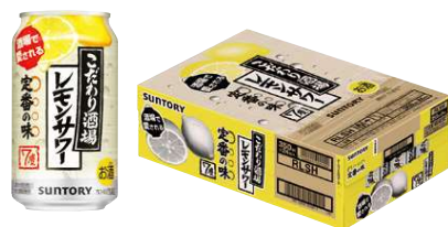
サントリー こだわり酒場のレモンサワー 24缶セット