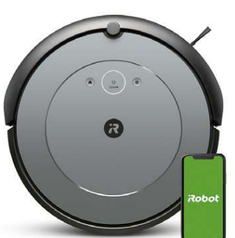
※スマートフォンは付属しません。

サイズ(各)/1.72×3.05×2.24cm 重さ(各)/6.24g 仕様/連続再生時間:最大6時間 付属品/充電ケース、USB-C(A-C)充電ケーブル、セーフティシート、イヤークリップおよびスタビリティバンド S・M・Lサイズ(各1セットは本体装着済) ※型番:QC ULTRA EARBUDS BLK