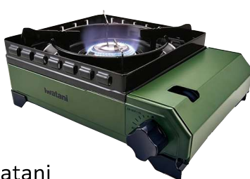
Iwatani カセットフー タフまる

サイズ/39×39×5cm 素材/カバー表地:ポリエステル55%・綿45%、中わた・カバー裏地:ポリエステル100%、中材(エアファイバー®):ポリエチレン100%