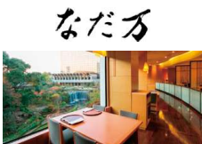
※紀尾井なだ万店内イメージ