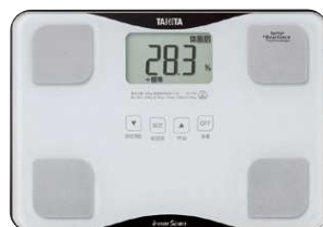
タニタ 体組成計 インナースキャン

サイズ/28×16×28cm 仕様/消費電力:最大36W、風量調節:3段階、角度調節:5段階(水平から真上) ※型番:KJ-4781W