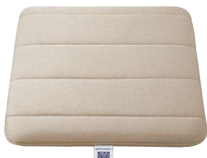
airweave エアウィーヴ クッション グレー